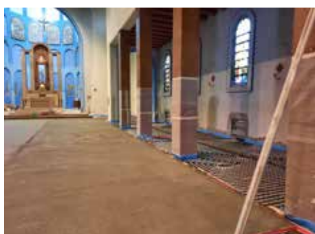
Impianto di riscaldamento a pavimento

to 11.5x24.0, individuato e ordinato presso un produttore tedesco, mantenendo il disegno nonché l'impatto cromatico e materico originari.