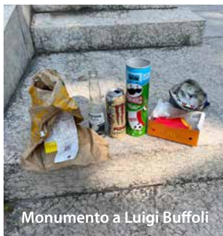
Monumento a Luigi Buffoli