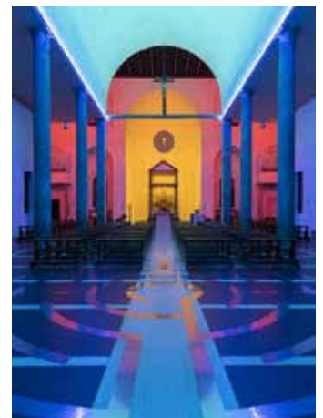
Progetto illuminotecnico Dan Flavin