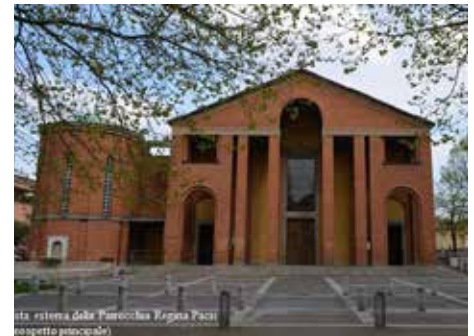
Chiesa Regina Pacis - Facciata principale

Si è optato per il pieno recupero di cromie e geometrie esistenti, pertanto è stata rimossa la pavimentazione originaria, fortemente usurata soprattutto nelle aree di maggior passaggio e posato un nuovo pavimento in piastrelle di Klinker forma-