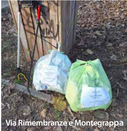
Via Rimembranze e Montegrappa