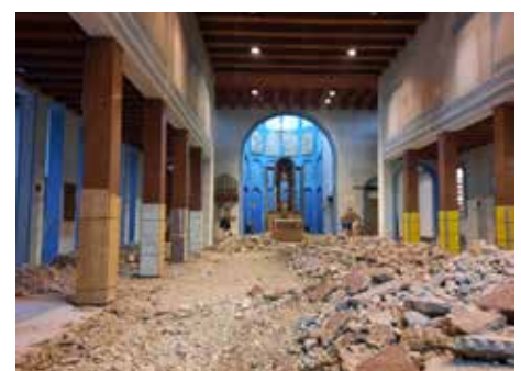
Demolizione pavimento esistente.