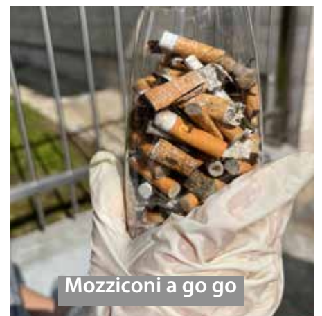
Mozziconi a go go