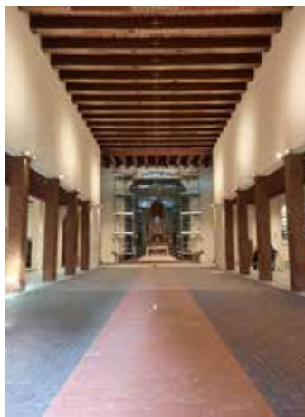
Vista navata principale di progetto