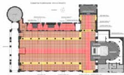
Planimetria pavimentazioni di progetto