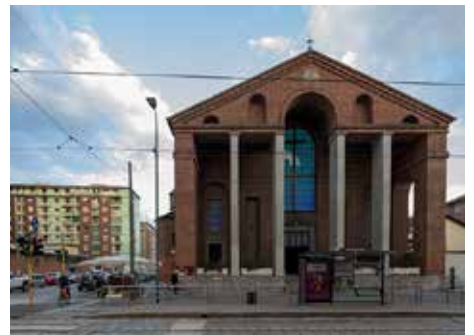
Chiesa S.M. Annunciata in Chiesa Rossa - Milano