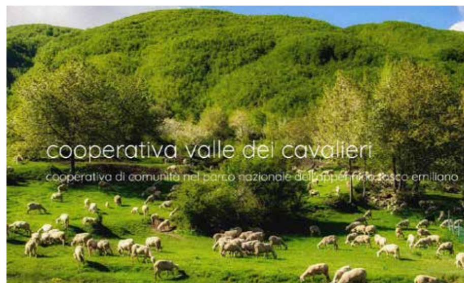
Prima pagina internet della Cooperativa Valle dei Cavalieri, un vero esempio virtuoso di resilienza.