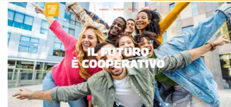
Giunto alla sesta edizione, Smart and Coop è un bando rivolto a giovani che vogliono trasformare i loro progetti in una realtà basata sui valori di equità, democrazia, inclusività e sostenibilità: una Cooperativa!