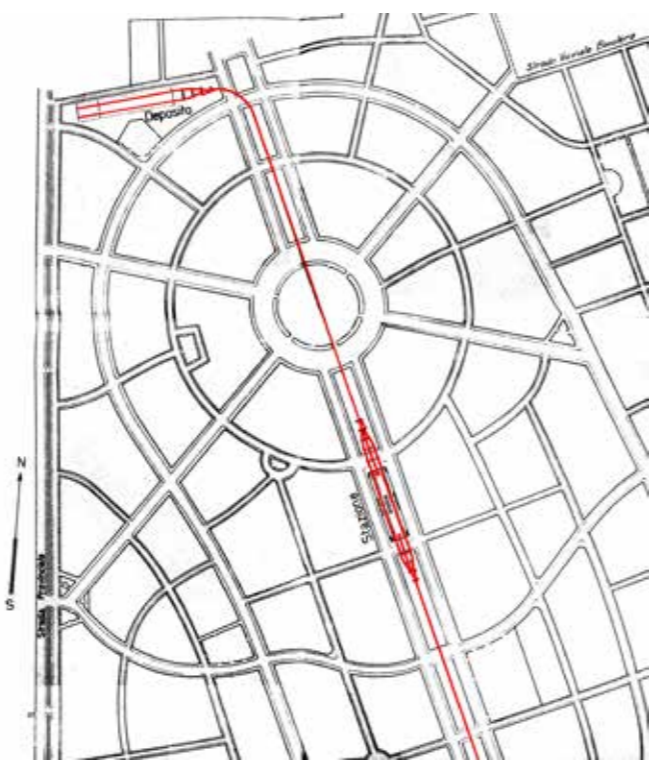
Il tracciato semplificato a Milanino

L'avveniristico progetto ebbe una vita molto travagliata e non vide mai la luce.