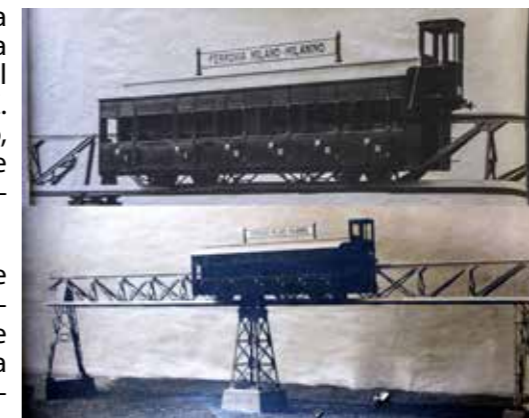
Fotografie del modello in scala 1:5 realizzato per propagandare il progetto. Dopo alcuni mesi nella Galleria dell'Unione Cooperativa, fu esposto all'Expo Torino 1911, dove Bellani e Benazzoli avevano realizzato i trasporti a fune tra le diverse sezioni della fiera. La tratta di rotaia era lunga circa 9 m, il vagone 3 m.

Perché il progetto è lasciato morire? Difficoltà nel reperimento di finanziatori? Forse. Grandi investimenti privati erano stati fatti non da molto nelle Ferrovie Nord, di cui la nuova tramvia, almeno per il tratto