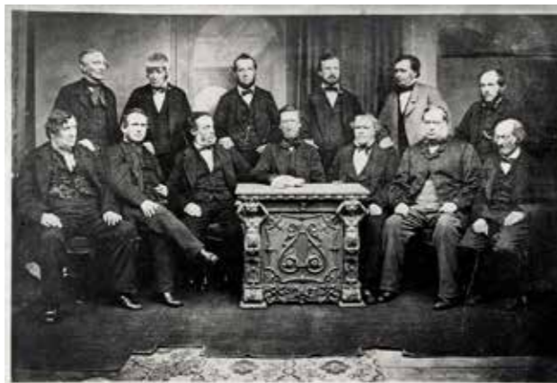
Famosa foto di 13 dei 28 Probi Pionieri di Rochdale UK eseguita circa nel 1865 - creando nel 1844 la "Rochdale Society of Equitable Pioneers", al centro Charles Howarth English Socialists, presidente della stessa.

Legacoop con il programma "Rigenera" dal 2010 aiuta a fare im-