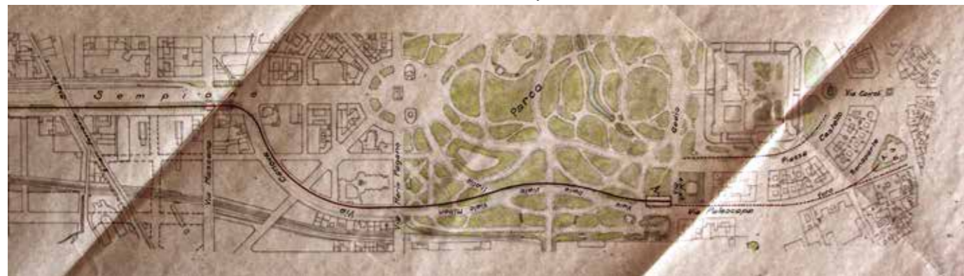
La parte finale del tracciato nel Parco (1° versione). Da notare il prolungamento ipotizzato fino in Piazza del Duomo

All'epoca la destra liberale a Milano sta attraversando