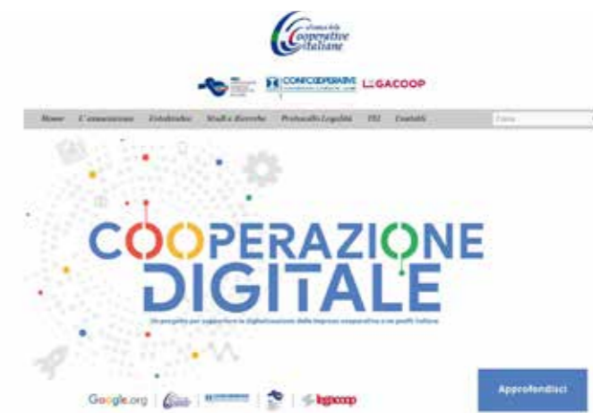
Dal sito internet dell'Alleanza delle tre maggiori centrali Cooperative Italiane costituita nel 2011, i 7 principi identitari sono sempre gli stessi.

Germina così l'autodeterminazione di gruppo, la solidarietà e quindi ritorna la Cooperazione.